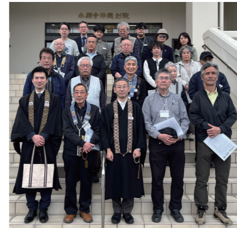
長野教区参拝団(戦後80年現地研修会)の皆さん