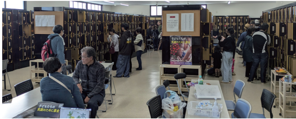
多くのご家族がにぎやかに参られた別院納骨堂

沖縄別院では、十六日祭(旧暦の1月16日)を機縁として仏さまの教えに耳を傾けていただき、毎年各所で「納骨堂総追悼法要」をお勤めしています。今年