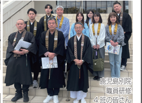
鹿児島別院職員研修4班の皆さん