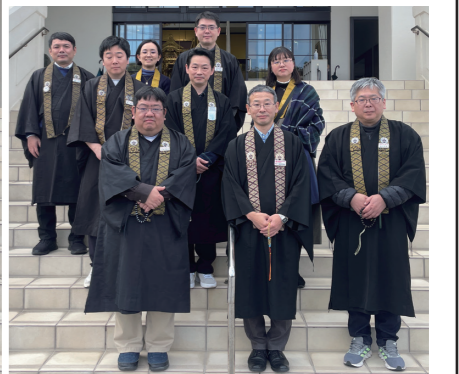
鹿児島別院職員研修1班の皆さん