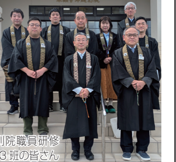
鹿児島別院職員研修3班の皆さん