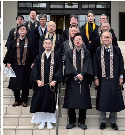
安芸教区組長会・教区会合同研修旅行の皆さん