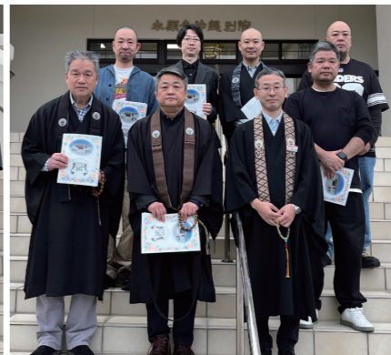
北豊教区小倉組安楽寺の皆さん