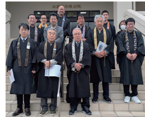
北海道教区札幌組重点プロジェクト平和学習参拝団の皆さん